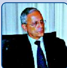
Gaetano Scaravilli Segretario Generale Presidenza della Regione Siciliana

Il principio di "Pari Opportunità" si sostanzia nel superamento di tutte le forme di discriminazione tra uomo e donna, nella promozione della parità tra i sessi nell'ambito dell'istruzione, della formazione professionale, del mercato del lavoro e della vita familiare, favorendo una equilibrata partecipazione tra donne e uomini nelle sedi decisionali politiche ed istituzionali.